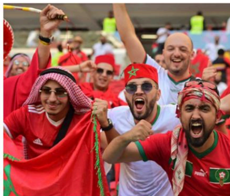
Les supporters marocains durant la coupe du monde 2022 .

Politiquement, le football peut être utilisé comme un outil de diplomatie et peut également être une source de tension entre les pays et les communautés. Les matchs de football entre nations rivales peuvent souvent être utilisés comme un moyen de construire des ponts et de créer un sentiment de compréhension, mais ils peuvent aussi être utilisés comme un outil de propagande et servir de programmes politiques. Et si on voulait parler de l'aspect culturel, ce jeu peut façonner les identités culturelles et être une source de fierté pour un pays ou une communauté. Il peut également être utilisé pour préserver les traditions culturelles et donner un sentiment de continuité aux communautés. Le football peut également être utilisé comme un moyen de présenter la culture et les traditions d'un pays au reste du monde.