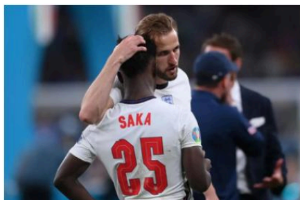
Saka, le joueur d'Arsenal qui a été victime de racisme .