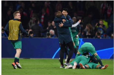
Qualification de Tottenham face à Ajax.

Sans oublier d'autres parcours comme celui de Tottenham FC et Ajax FC dans la saison 2018/2019. Ce sont ces surprises qui font du football un jeu spécial et qui empêchent de s'ennuyer. Sans cet aspect, je n'aurais pas personnellement passé toute ma vie à regarder à chaque fois les compétitions professionnelles, et je me serais limité plutôt à ma pratique personnelle de football.