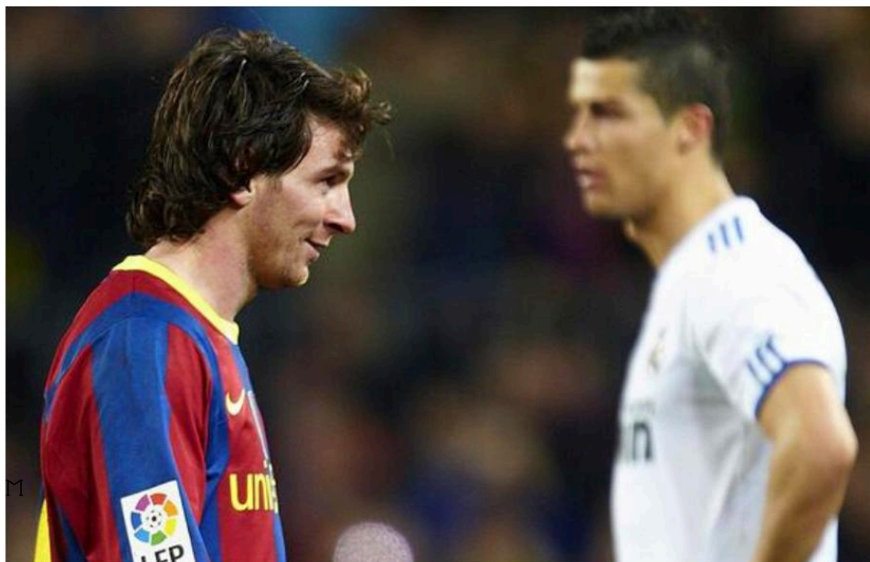
Photo prise du Lionel Messi et Cristiano Ronaldo en 2010.

Mon frère, lui, était un fervent supporter du Real Madrid et il souhaitait que je l'imite. Je me rappelle encore la fois où je lui ai demandé un maillot du Barça, il m'a offert celui du Real Madrid et a tenté de me convaincre que c'était la meilleure équipe. Malgré tout, j'ai persévéré dans mon choix et c'est ainsi que j'ai continué à le supporter jusqu'à maintenant.