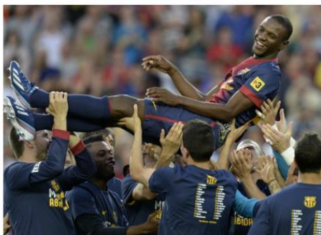
Eric Abidal après 6 ans de résistance à sa maladie.

L'une de ces histoires est celle du joueur du FC Barcelone Eric Abidal. En 2011, Abidal a reçu un diagnostic de tumeur au foie et a subi une intervention chirurgicale pour l'enlever. À peine six mois plus tard, il a fait un rétablissement miraculeux et est retourné sur le terrain pour aider son équipe à remporter la Ligue des champions. Son capitaine Carles Puyol lui a donné l'honneur de lever la coupe pour sa détermination et sa résilience face à l'adversité qui ont inspiré non seulement ses coéquipiers, mais aussi les fans de football du monde entier.