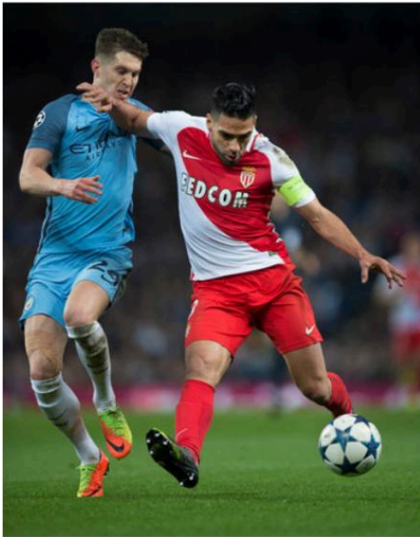
Manchester City contre AS Monaco en 2017.

Remarquons donc les opportunités que le football offre aux rêveurs et aux gens qui ont du talent mais qui font aussi l'effort et jouent avec amour.