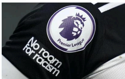
Le message de sensibilisation dans le premier league: "pas de place pour le racisme".

Or, toutes ces perturbations du football restent, en fin de compte, négligeables devant ce que ce sport nous apporte en tant que des amateurs de foot spécialement et en tant qu'une société d'une façon plus générale. Il a désormais un impact sur de nombreux aspects de toute la société, notamment l'économie, la communauté, la politique et la culture.