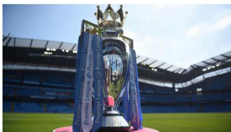
Trophée de la ligue anglaise 'Premier League'.