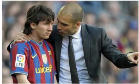
Photo de Messi avec Guardiola en 2010.

Pepe Guardiola, l'un des meilleurs entraîneurs de tous les temps, s'il n'était pas leur meilleur, a admis que ses tactiques lors de son époque avec FC Barcelone, où l'équipe a triomphé en Europe avec son style de "tiki-taka", ont été rendues possibles en grande partie grâce à Lionel Messi. Ce qui est globalement vrai, car Messi est un joueur unique. Cependant,