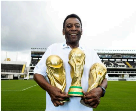
Pelé pose avec les trophées des 3 Coupes du monde remportées avec le Brésil.

Il a également été un ambassadeur pour le football et pour de nombreuses causes sociales. Il a fondé l'Institut Pelé, qui vise à promouvoir le sport et l'éducation pour les enfants défavorisés. Il a également été nommé ambassadeur de bonne volonté pour l'UNICEF.