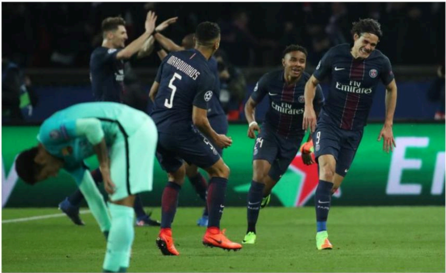
Le match de l'aller entre Fc Barcelone et PSG en 2017.

un résultat quelconque. Je parle en tant qu'amateur de football professionnel, qui a vécu plein de moments spéciaux qui montrent cette dimension. Notamment, à la saison 2017/2018, où le tirage au sort a mis le FC Barcelone contre le PSG en huitièmes de finale. C'était une version de Ligue des champions où les deux clubs étaient favoris pour l'emporter. Le Barca d'une part avec le trio effrayant MSN et le PSG plutôt avec une équipe homogène bien construite avec Di Maria, Cavani et Verratti. Le rendez-vous de l'aller a été atteint sur le Parc des Princes. Le terrain était plein de supporters, bref une ambiance incroyable. Comme ce n'était jamais prévu, le PSG s'est impliqué devant ses supporters et a écrasé le Barca 4-0. Paris a un pied et quatre doigts en quart de finale. PSG - Barça : le film du match. C'est terminé ! Le PSG s'impose 4-0 et humilie le Barça !, a publié L'Equipe en exprimant la honte que ressentent les Barcelonais après le match. En tant qu'amateur de Barca, le sentiment était difficile, le résultat était inacceptable, c'était honteux... Les gens ont commencé à quitter les salles de match dès le 3ème but, je me rappelle. C'était vraiment une nuit sombre pour nous. Il y avait des gens qui