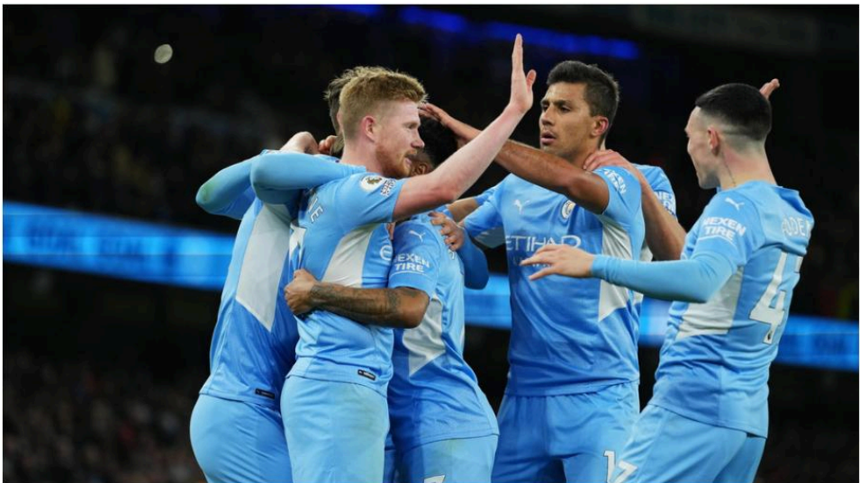
Photo de quelques joueurs de Manchester city.

Guardiola a également démontré sa grande qualité en tant qu'entraîneur en construisant une équipe de Manchester City époustouflante jamais vue auparavant, et cette fois-ci était sans Messi. Il a construit une équipe qui amuse avant de gagner, et qui montre un niveau de cohésion incroyable reflétant sa capacité à diriger efficacement les joueurs pour mettre en œuvre sa tactique. Bien qu'il n'ait pas réussi à remporter la Ligue des champions avec eux, il a dominé la Premier League d'Angleterre, considérée comme la plus difficile de toutes, et a imposé encore une fois son style de jeu. Tout cela pour dire que le football est un jeu d'intelligence et de tactique qui ne se limite pas à un talent, une passion ou une chance.