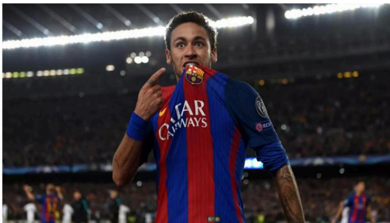
Photo de Neymar Junior après la Remontada.

important de garder l'espoir jusqu'au bout, et c'est ce qui a finalement mené à l'incroyable remontada du Barca, qui est devenue l'un des moments les plus mémorables de l'histoire du football. Bref, ce moment a été particulièrement mémorable pour moi.