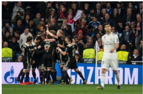
Photo lors du match entre Ajax et Real Madrid en 2019 .

Je parle de ce sentiment de regarder un match dont le résultat reste imprévisible. Et c'est cet aspect qui fait de moi un grand fan de la Premier League, qui est la ligue locale d'Angleterre. Elle est considérée comme la meilleure ligue au monde, et cela est dû au degré extrême de suspense qu'on y trouve. Cette suspense est due à plusieurs raisons. Tout d'abord, elle rassemble les meilleurs joueurs et les meilleurs entraîneurs du monde. Elle attire également des milliers de fans dans les stades chaque semaine, et est suivie par des millions de téléspectateurs à travers le monde. De plus, la compétition est très relevée et les matchs sont souvent très