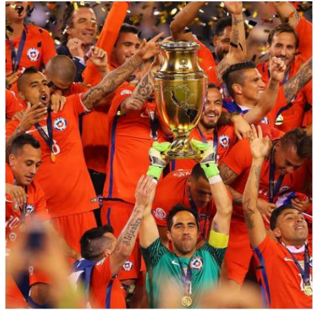
Le Chili a remporté la "copa america" pour la deuxième fois consécutive.

L'équipe nationale chilienne a toujours été éclipsé par ses voisins les plus prospères, l'Argentine et le Brésil, mais après, l'équipe a pu atteindre un niveau de succès auparavant inimaginable. Ils ont remporté la Copa America en 2015 et 2016 devant l'Argentine. Ces réalisations n'étaient pas seulement le résultat du travail acharné et du talent des joueurs, mais aussi un témoignage de la puissance du travail d'équipe et de la capacité d'un groupe d'individus à réaliser quelque chose de plus grand qu'eux-mêmes.