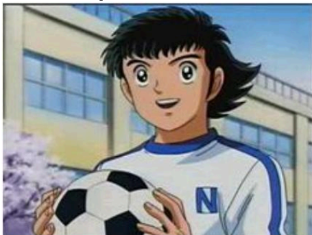
Le personnage principal de l'animé "Le Capitain Majeed". Crédits : Yoichi Takahashi, l'auteur du Manga original.

Un jour, mon père est rentré à la maison avec un petit ballon pour moi, comme il me l'avait offert pour beaucoup d'autres jouets avant. Cette fois-ci cependant, j'étais plus heureux car je me suis dit, « Maintenant, je pourrais faire comme Majeed... ». Tout a commencé avec ce ballon, il n'y avait plus d'animé après l'école, mais juste jouer avec ce ballon dans la grande cour que nous avions à la maison. Je jouais tout le temps, que ce soit avec un ami, mon frère ou seul. C'est là que j'ai commencé à aimer le football et où il est devenu le moyen pour moi de trouver mon plaisir.