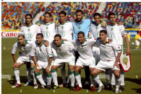
Photo de l'équipe nationale marocaine en 2006.

regarder un match de football de l'équipe nationale marocaine lors d'une Coupe d'Afrique. Cette scène m'a surpris, notamment car ma mère qui n'est pas généralement intéressée par ce sport était elle aussi captivée par le match. Je ne me rappelle pas exactement le match en question, mais je me souviens de l'ambiance électrique qui régnait, tant à la maison qu'à l'extérieur, avec des chants et des cris de joie. C'est à ce moment-là que j'ai commencé à prendre conscience de l'impact émotionnel que peut avoir le football sur les individus et du plaisir qu'il peut nous offrir.